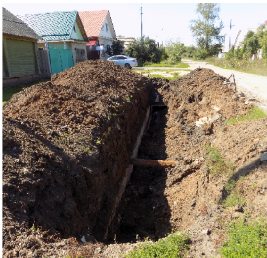
И ничего не происходило