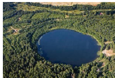
Для сравнения: озеро Светлояр. Startour.ru

Я не испытал того «животного страха», выйдя к озеру в том же 2017 году. А вот восторг и настоящую человеческую радость я действительно испытал! От ощущения того, что нашёл этот таинственный водоём! И нашёл не «реально мёртвым», а наполненным жизнью: отчаянно вопил лягушачий хор, ухала в прибрежных тростниках выпь, бороздили озёрную гладь стайки диких уток. И вода вовсе не показалась мне «неестественно чёрной», напротив; изумрудно-голубой, чистой и прозрачной.