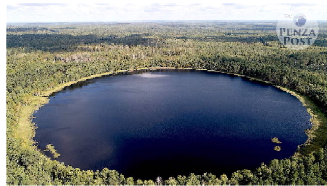
Мёртвое озеро с высоты птичьего полёта

31 августа 2019 года в двух километрах от Мёртвого озера гудело торжество. По поросшим вековым лесом улицам средневекового города ходили толпы экскурсантов. Их встречали люди из XIII века: воины буртасские, болгарские и мокшанские, защищавшие свой город от полчищ Батыя, и воины монгольские, взявшие и уничтожившие эту крепость вместе с жителями. На поляне неподалёку от крепостных валов кипели торги и ристалища: про-