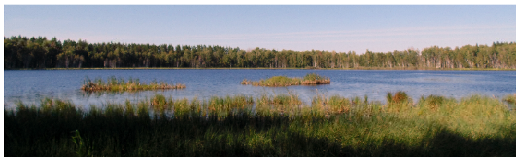
На берегу Мёртвого озера 31 августа 2019 года.