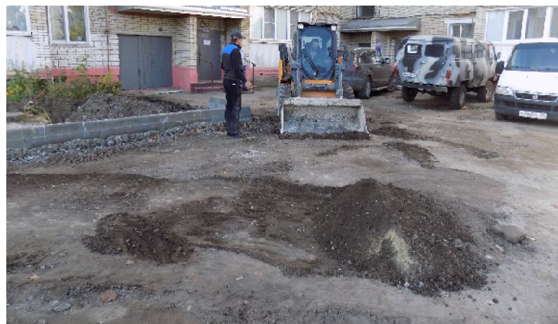
Работы небыстро, но ведутся