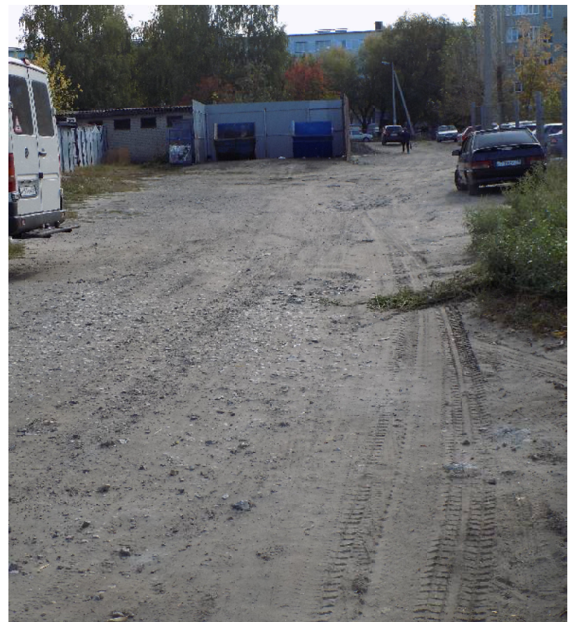
До конца срока ремонта осталось 10 дней

рили, но всё равно обрадовались: не 29-го так 30-го; не 30-го, так 31-го июля... Целый август впереди! Постепенно радость уступала место разочарованию: люди срывали листки календаря и смотрели в окно, за которым совершенно ничего не происходило. Очередная смена эмоций произошла, когда жильцы увидели на своих подъездах объявления, просившие не ставить личные автомобили у дома, так как 10 августа работы начнутся. Наступило 10-е августа... и ничего не началось. Только в конце последнего летнего месяца наметился сдвиг: во двор был завезён стройматериал – немного, но много ли надо для надежды на счастье? Обнадёженные стали пристальнее вглядываться в окна, рабочих углади 5 или 6 сентября. Долгожданная бригада демонтировала старое покрытие, бордюры устанавливает, в целом работает неплохо... когда ма-