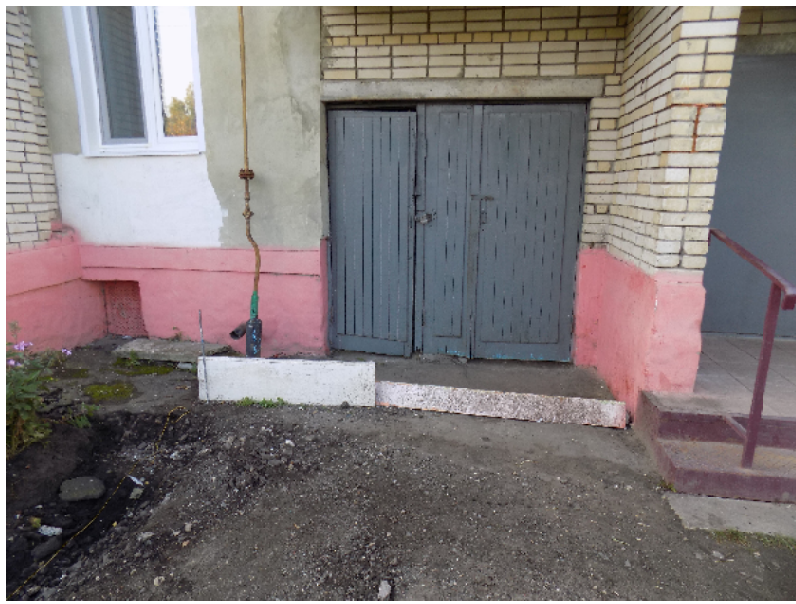
Подрезать двери или асфальт?

На выполнение контракта давалось 60 дней. С учётом позднего старта работы должны вестись в два раза интенсивнее, а