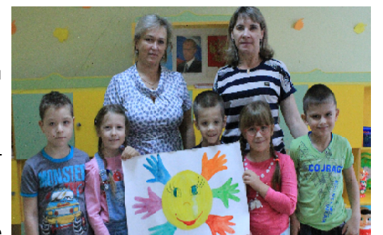
вил детям массу положительных эмоций.

узнали много нового и интересного о народностях, проживающих на территории Пензенской области, об их традициях и обычаях, познакомились с народными костюмами разных национальностей. Совместно с педагогами дети подготовили выставку открыток, смастерили «волшебное солнышко». Расположив вместе силуэты своих ладошек, как будто крепко держась за руки, малыши все вместе заставили светить солнышко ярче и согреть своим теплом всех вокруг! Праздник доста-