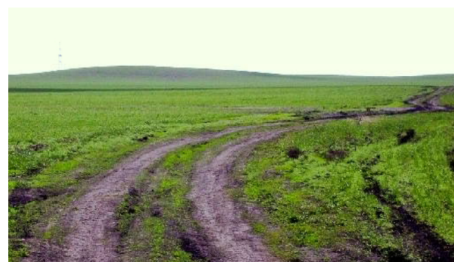
Между Евлашевом и Селитьбой