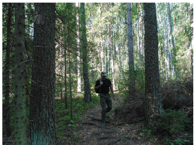
Тропы Батыевы: в Нижегородском Заволжье