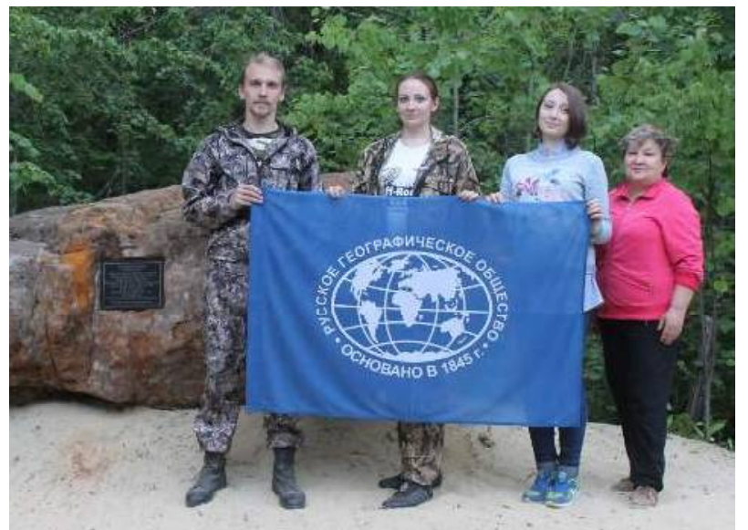
На самой высокой точке...

Без нескольких дней десять лет назад группа энтузиастов из Пензенского географического общества отыскала тот камешек. «КамАЗ» с краноманипулятором погрузил и доставил будущий монумент к самой главной высоте Кузнецкого района и всей губернии. Здорово посдействовала доставке и установке сандстоуна кузнецкая компания «Визит». А указал на высоту