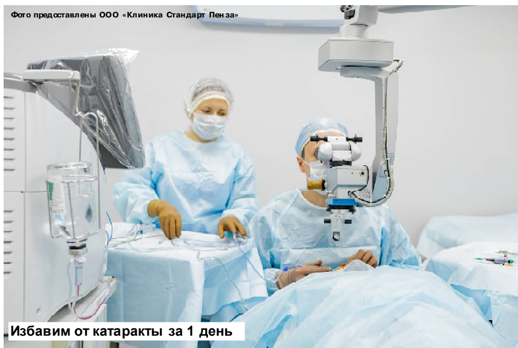
Избавим от катаракты за 1 день

Все операции в клинике делают амбулаторно и отпускают пациента домой. Уникальное хирургическое оборудование операционного блока, позволяет минимизировать вероятность осложнений и максимально сократить период восстановления. Примечательно, что в клинике царит домашняя атмосфера, а в операционной играет музыка, убирая страх и успокаивая пациента.