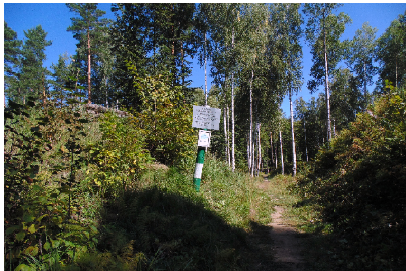
«Вас» Золотарёвского городища

А почему вас , и не оз ? <a> (а с англстремом) – это звук, сред-