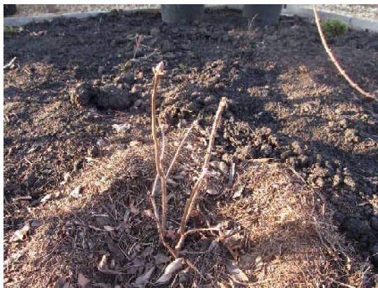
Замульчированная азалия готовится к зиме

различать такие понятия, как «заморозки» и «мороз». О наступлении заморозков можно говорить в том случае, если утренний лед на лужах ближе к полудню начинает таять. Если лужи остаются замерзшими до самого вечера, то пришли морозы. Недолгое понижение температуры – заморозки – опасности не представляет. И если даже снега еще нет, почва на глубину залегания корневой систем растений промерзнуть не успеет. Навредить могут уже достаточно сильные (свыше -15°C) морозы, которые держатся в течение нескольких суток без снежного покрова.