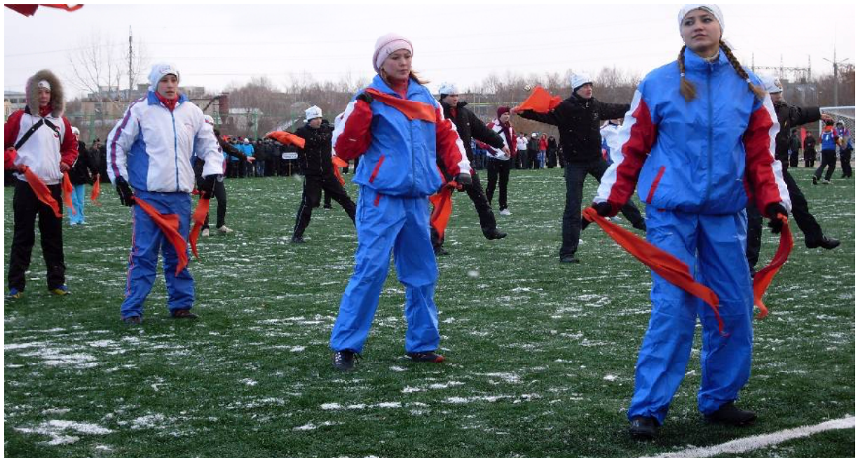
Спортивная площадка в Западном микрорайоне вчера...

В 2020 году, скорее всего, в Кузнецке появится физкультурно-оздоровительный комплекс открытого типа. 28 ноября об этом кузнецким сообщил губернатор Пензенской области – именно в такой формулировке «скорее всего». Официальное решение будет озвучено в декабре этого года, но принципиальное (скорее всего) уже принято.