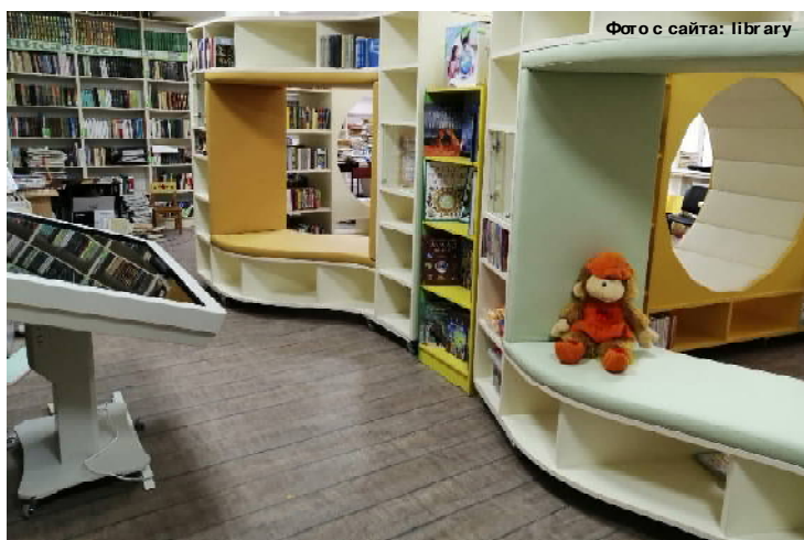
Библиотеки будущего: модельные библиотеки

А работники культуры города в ближайшие годы будут занимать выжидательную позицию, точнее активно-выжидательную: необходимо разработать проектно-сметные документации, чтобы в 2022-м получить средства на чудесное превращение обычных библиотек в модельные. Для справки: модельные (Окончание на стр. 2)