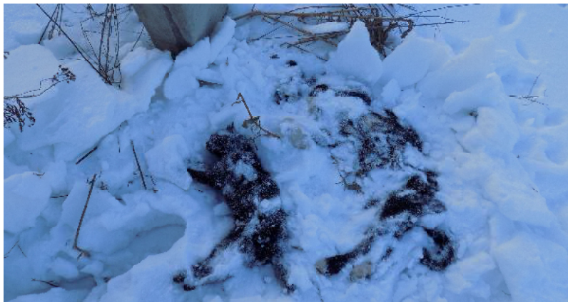
Убитые в Западном микрорайоне животные. Февраль 2018-го года.