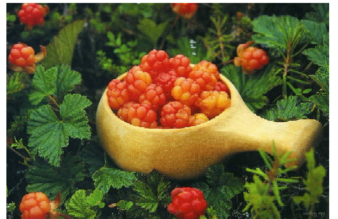
Морошка приземистая (Rubus chamaemorus).