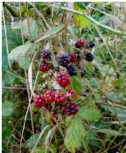
Куманика в Абрау-Дюрсо.

А ведь край наш, Верхнесурье-Белоозерье – почти юг по сравнению с областью Вологодской,