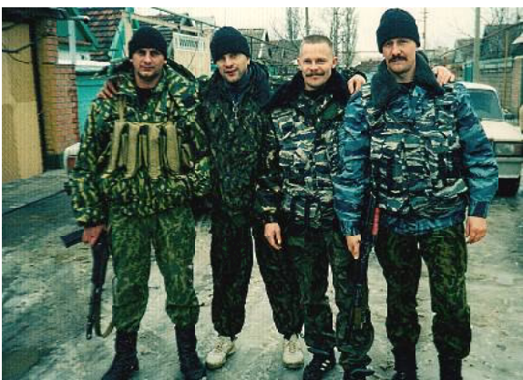
Чечня. 2001 год