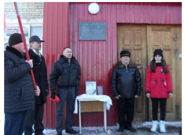
На церемонии открытия мемориальной доски в с. Пионер

Принимаются в эту организацию не только участники боевых действий, если человек просто служил в Российской или Советской армии и идея товарищества