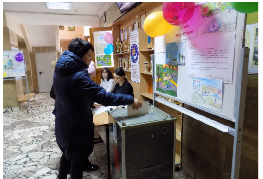
Рейтинговое голосование по определению общественной территории для включения в программу «Формирование комфортной городской среды» в 2019-м году

Некоторые предложения были отклонены в связи с тем, что указанные территории ждёт большее, нежели 3 – 4 миллиона рублей, выделяемых Кузнецку на благоустройство общественных территорий. Так, капи-