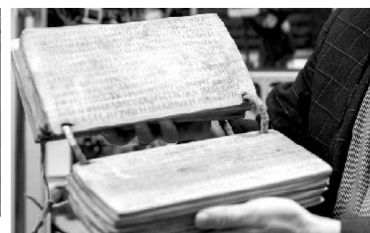
«Прикосновение к Бикмуллинскому феномену...».