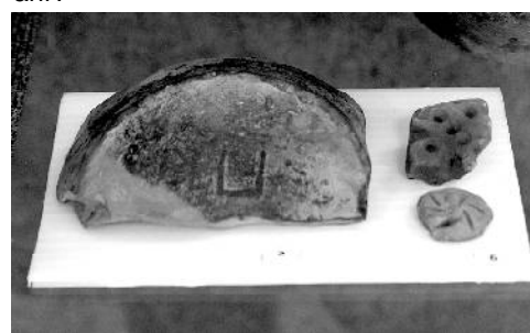
«Золотарёвская надпись».

В №19 (2729) от 10 марта, в очерке «Кузнецкий бренд многовековой давности» была допущена ошибка в подписях к фотографиям. Публикуем правильный вариант: