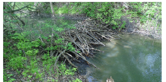
Бобровая плотина на реке Каранголь (она же Карангал, Керямчул, Эрзялейка...)

Я писал, что Каранголь имеет второе название: Керямчул. Ошибся! Как выяснилось из «третьего крангольского путешествия», у этой реки четыре (!) имени: Каранголь, Карангал, Керям-