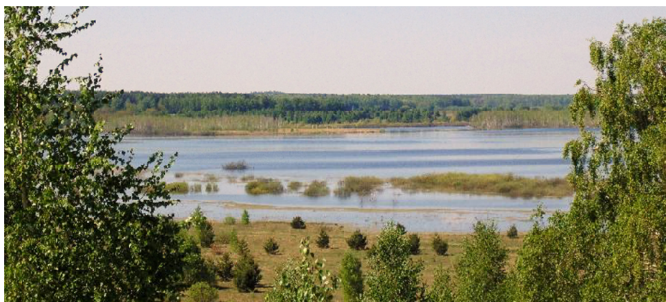
Бобровская котловина летом 2019 года.

МБУ «Управление по делам ГОЧС г. Кузнецка».