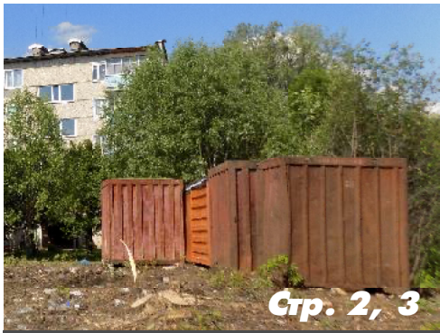
Стр. 2, 3