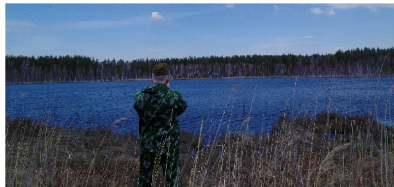
Светлое озеро (середина апреля)