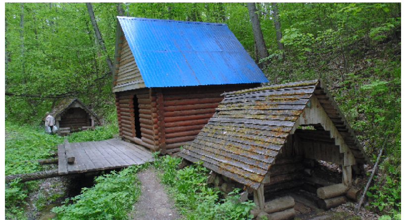
В Поповом долу на истоке Кумалейки

Хозяйка одного из домов частного сектора в Пятигорске, у которой наша семья останавливалась «на постой», призналась нам: «Мои гости, бывает, так много рассказы-