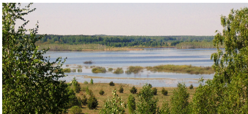
Кузнецкое море – озеро Бобровское