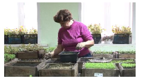
Раньше «Зелёный город» рассаду не покупал, а выращивал

За рубль рассаду, наверное, никто не продаст, а семена (одно семечко) вполне возможно. И ведь раньше работники муниципального предприятия «Зелёный город» рассаду выращивали сами. К работам по озеленению города начинали готовиться ещё зимой. Рассада занимала несколько помещений предприятия и подлежала постоянному уходу. В стенах «Зелёного города» подрастали петуния, аге-