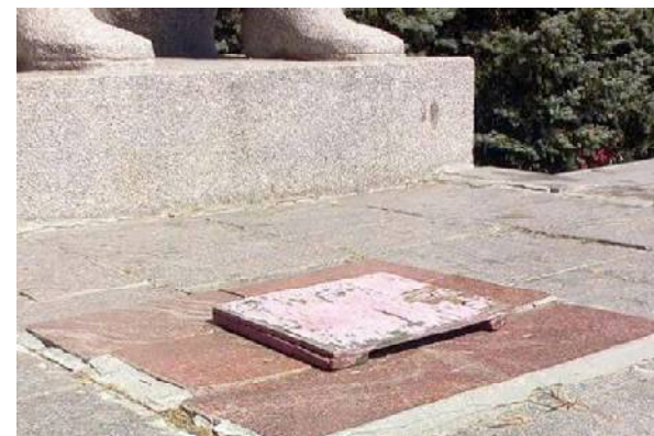
«Зелёный город» деревья не пилил, а Вечный огонь был потушен ветром.

Сначала директор МКУП «Зелёный город» заявил, что