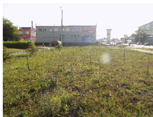
Лето 2020-го: колышки вместо саженцев

Местные жители рассказали, что произошло: пришли люди, начали рубить деревья. Любители природы попытались их остановить и остановили, но срубленный ствол назад не приставишь. По словам жителей, на