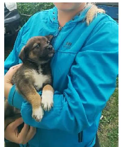
«Мальчик» из разрушенного детского сада обрёл дом и семью