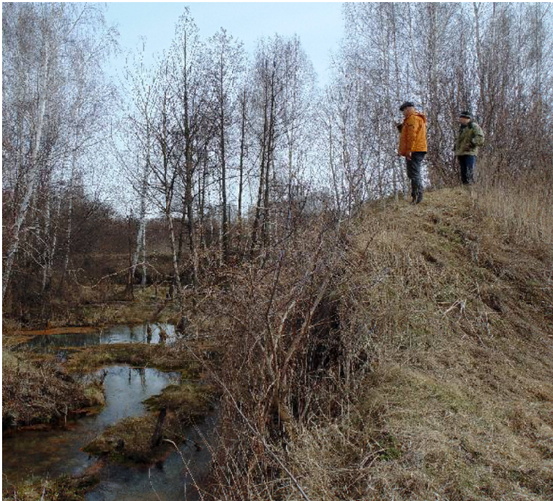
Путешественники на обвалованном крутом берегу над Зелёным Ключом

С целью обнаружения водоёма-призрака, «маленького, но очень глубокого озера» с очень крутыми берега-