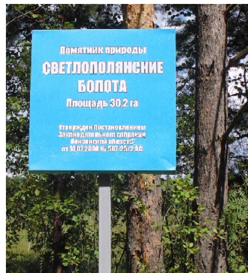
Но и здесь ступала нога человека...

Скользит дорога почти берегом и настоящих моховых и торфяных болот (Светлополянские болота и другие) тоже в западинах округлой формы с окнами открытой воды и коварными тёмными чарусами... (Почти всё как в настоящей Мещёре, открытой читателю К. Паустовским). Всего раз за почти целый день бродяжничества по «Пензенской Мещёре» мне попались существа человеческого рода, и то в «Джипе» с открытым верхом (на невезуходной технике кататься по здешним пескам-болотам рискованно).