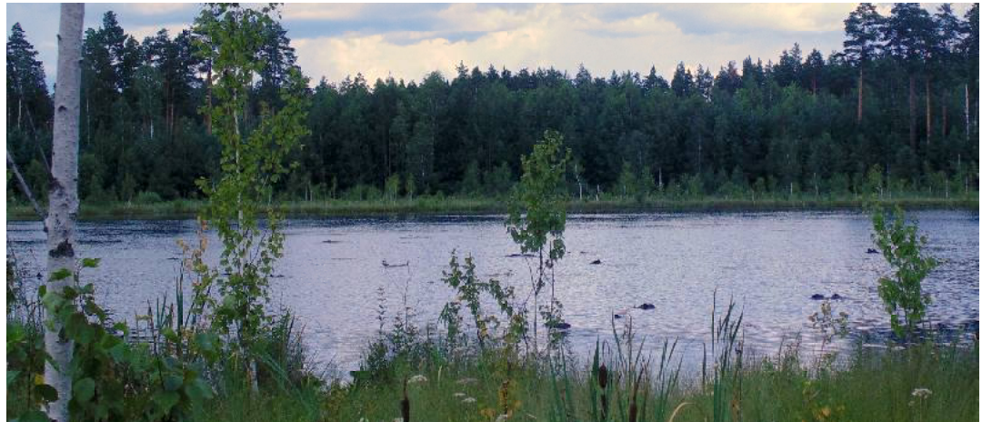
«Смерть лесника» – довольно симпатичное озеро

Первое моё путешествие по Завядьё было «карточным». Разглядывая физическую карту Пензенской области, я сделал вывод, что та местность в плане рельефа заметно отличается от других ландшафтов восточной части региона.