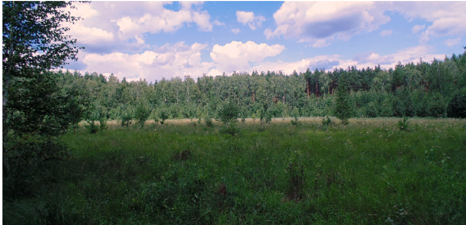
В 1980 году здесь было озеро, в 2020-м – травяное болото