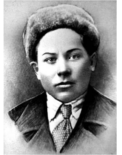
Герой Советского Союза Виктор Блохин.

В статье Википедии «География Пензенской области» теперь так и указано, что «самая высокая точка территории – 342,037 метра над уровнем моря!» (На территории нашей области, разумеется). Хотя не столь