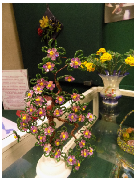
Фото с выставки творчества незрячих кузнецчан «Нам через сердце виден мир» (2017 год).