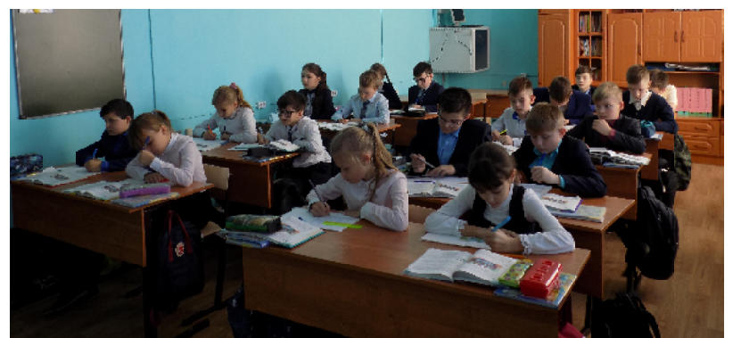
Обновлённый класс математики