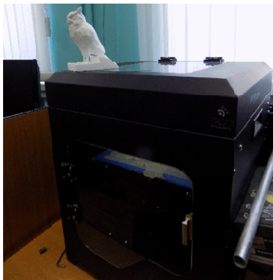
Филин – символ мудрости. А этот филин ещё и символ победы