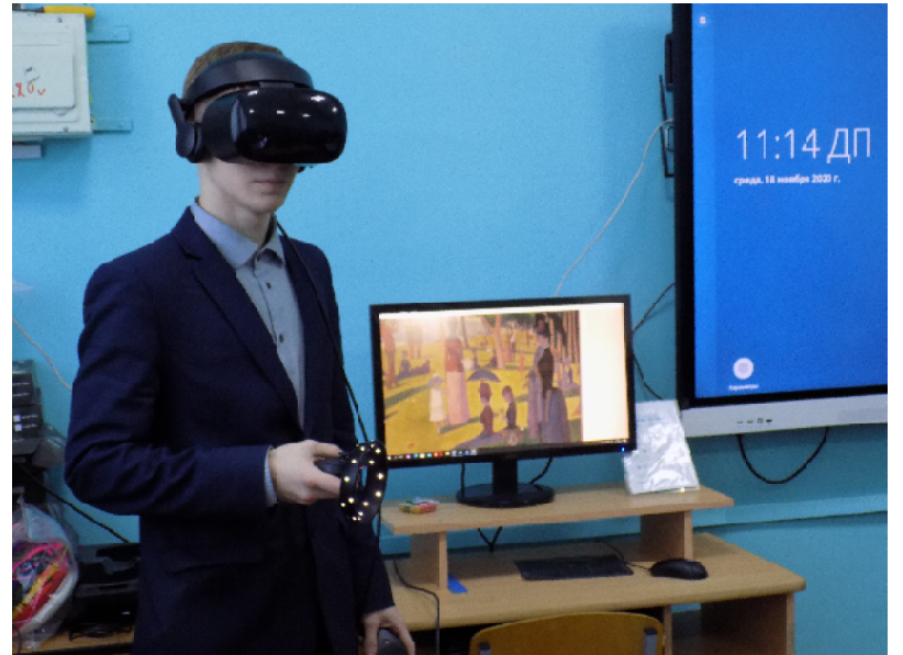
«Я поведу тебя в музей», – сказал мне шлем виртуальной реальности

Лицей №21 станет местом встречи всех кузнецких школьников, заинтересованных в углублённом изучении математики и информатики. «По условиям проекта, в нём участвует 150 учащихся лицей и столько же учеников других школ Кузнецка. На базе лицея организованы образовательные модули, обучение ведут наши учителя и преподаватели пензенских вузов (последние – пока в режиме онлайн), – рассказывает руководитель проекта «Межшкольная интеллекту-