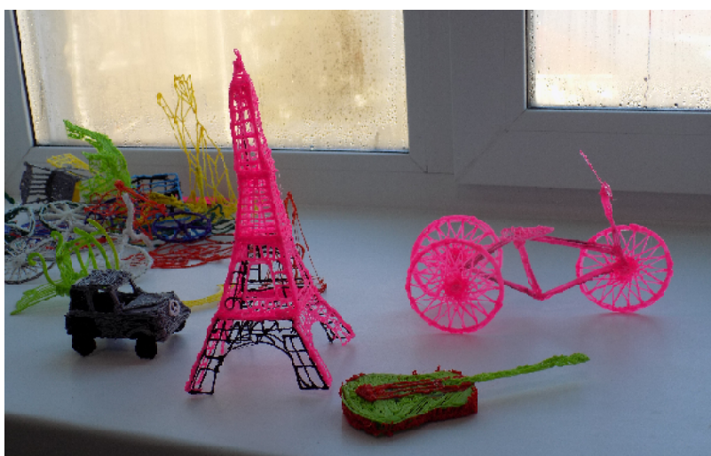
Эти игрушки вышли из-под пера 3D

нута главная цель предоставления федерального гранта, обозначенная координатором центра компетенций по кадрам для цифровой экономики национальной программы «Цифровая экономика РФ» Олегом Подольским: «Молодые люди составят больше половины экономически активного населения в ближайшие 10 лет, а с учетом демографической ямы молодых специалистов в стране будет на 30% меньше, чем в десятые годы. Поэтому забота о подрастающем поколении, их мотивация и развитие сегодня определяют экономический успех нашей страны завтра. Учитывая, что все самые востребованные специальности цифровой экономики строятся на дисциплинах математики и информатики, работа по вовлечению людей в цифровые профессии должна вестись со школы».