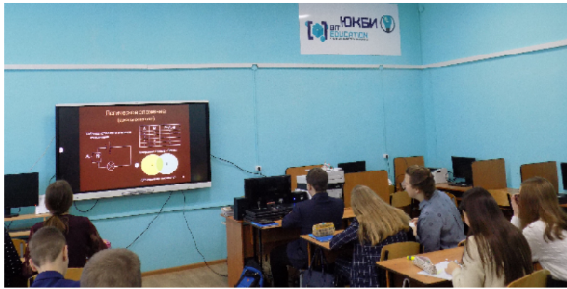
К интерактивной панели пойдёт...

Естественно, федеральные деньги были выделены не для развлечения школьников. Но, чтобы вышеназванные волшебства происходили, их нужно запрограммировать: разработать программное обеспечение. А вот для этого ребёнку надо развить собственный интеллект. Этим и занимаются под руководством учителей, преподавателей вузов учащиеся лицея №21 и других кузнецких школ, пожелавших принять участие в проекте «Межшкольная интеллектуальная лаборатория «ЮКБИ» («Юный конструктор – будущий инженер»). С этим проектом лицей победил в конкурсе на предоставление грантов в