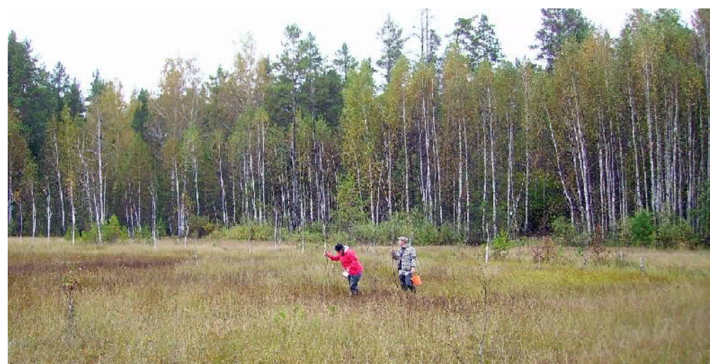
Вишнёвское клюквенное болото.