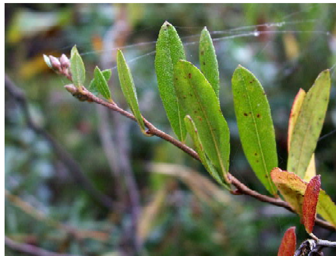
Мирт болотный (хамедафна, кассандра).