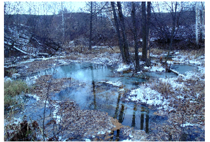
На снимке тот самый Зелёный Ключ, о котором ещё около века назад писал М. Чинаев: «Он не замерзает в самые сильные морозы». Теперь мы сами в этом убедились.

И пусть испокон веков знали об «открытом» нами жители Татарского и Мордовского Канадея, Николаевки и Барановки, Славкина и Пичеура... Открыли