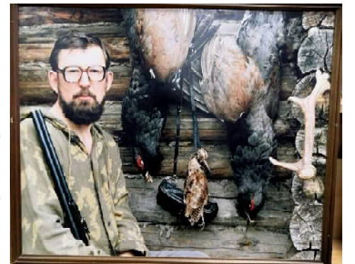
Фотопортрет с экспозиции первых Бикмуллинских чтений. Сайт Кузнецкой библиотечной сети

Мы на Берёзовом болоте. Где-то здесь, у бережка, коротал бессонную ночь у костра заблудившийся двенадцатилетний «Зверобой – Натти Бампо» – Анвярка», «в ребятах» известный ещё почему-то как Борька. Отсюда же рано поутру, услышав петушинный крик с кордона деда Максима, взял верное направление на заимку старшего товарища. Сюда же много и много раз ещё возвращал-