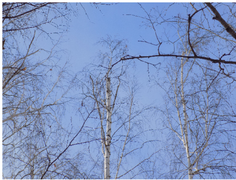
Верхушки нескольких берёз действительно срезаны

решения по факту жестокого обращения с животными.