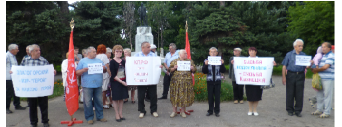
Кузнецк. Август 2015-го. Митинг против передачи объектов водоснабжения и водоотведения в концессию

Вопрос, с какой целью открыто это ООО. Поищем ответ... в 2015-м году. В марте 2015-го года при «живом» муниципальном предприятии в городе появилась новая организация – ООО «Кузнецкводоканал» (учредили её «гости горо-