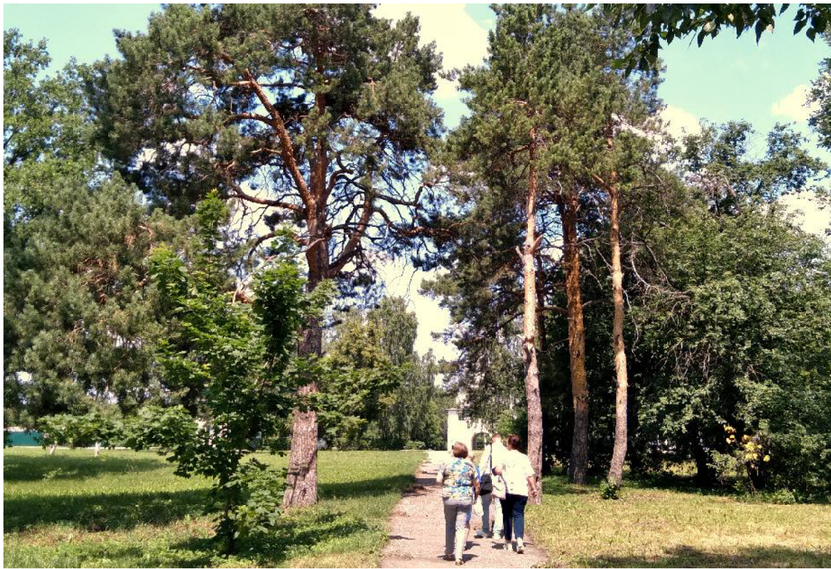
Зелёный рай усадьбы Радищевых

*По поводу места рождения основоположника русской литературы до сих пор не утихают споры. Но мы настаиваем: Радищев наш! В Верхнем Аблязове и больше нигде увидел он свет!