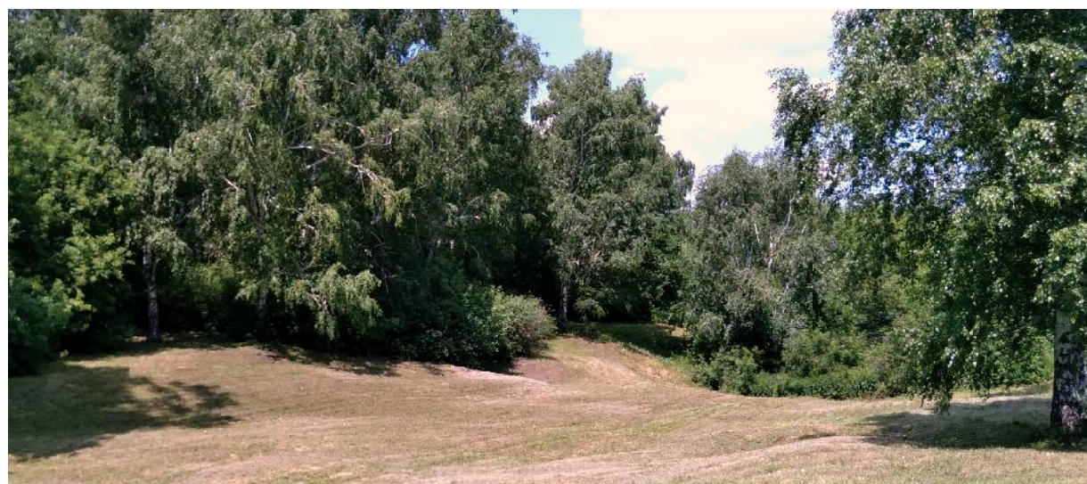
А здесь когда-то был усадебный пруд...