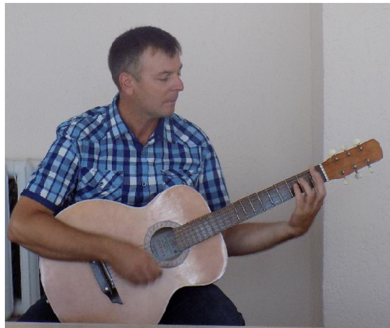
Он ещё и поёт!

«Когда-то, давно уже, я предложил называть природно-географическую территорию кузнецкого края и прилегающих районов Верхнесурьем».