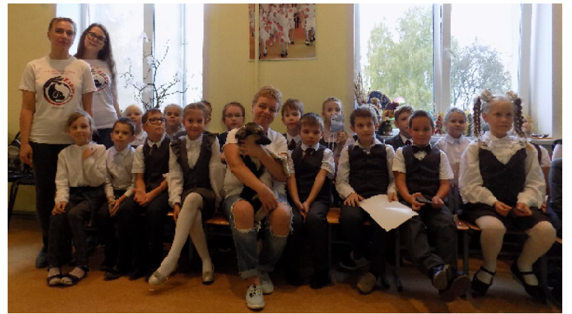
Беспредельно ласковая Красотка к концу урока немного устала от ласки

Так доступно объясняли школьникам волонтеры опасность самовыгула. А чтобы не быть голословными, они рассказали и показали несколько печальных историй о том, как пострадали на улицах города животные. Котёнка Персика нашли с перебитыми задними лапками: по характеру травмы было ясно, что кому-то из людей перешёл котик дорогу в неподходящий час: машина его «зацепила» или палкой избили, волонтерам было не так важно, как помочь усатому хвостатому ребёнку. Персика отвезли на операцию в Саратов, потом долгое время временная добровольная хозяйка массирует ему лапки. И чудо произошло: котик начал ходить. И второе чудо произошло: для похожего на лисёнка пушистика нашёлся постоянный дом. Спасти и отдать обязательно в доб-