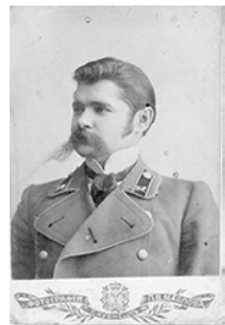
Николай Германович Ган. Из архива Радия Губайдуллова

Те болота, что лежат в отдалении от озера (Горелое и «у кемпинга»), своего рода природные резервуары, накопители воды, гигантские губки в днищах природных котловин-западин. Они отдают часть набранной во время снеготаяния влаги, а каналы несут её в торфяники Лимбай и Северное. В том-то и заключена экологическая мудрость, с которой вполне полно проектированы: торфяники на побережье выполняют