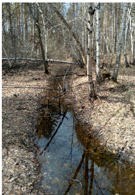
Канал у кемпинга.