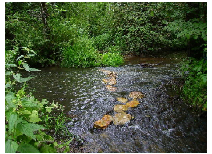
Одна из Медаявок. Река моего детства

Наша кузнецкая земля начала XVII века – это обширное незаселённое лесное пространство (Кудодейский лес) с редкими хижинами бортников и охотников-промысловиков из местных коренников эрзи и мокши. Именно наши сурско-кададинские лесные сообщества наглядно являли миру то, что сейчас биологи и экологи называют биоразнообразием. Лес на границе со степью обычно испещрён естественными луговыми полянами (как и в нашем случае). А в довершение этого в лесах между речья Кадады и Суры сохранилось и немало реликтов таёжной растительности, оставшихся от ледниковой эпохи. И такая местность – скопище «ботаники», как лесной и таёжной, так и лугово-степной. На площади в один квадратный километр здесь могут одновременно произрастать свыше пятидесяти трав и древесных растений, являющихся мёдоносными. «Кудодейский лес» – благодатное пастбище с богатой взяткой для дикой мёдоносной пчелы (так было, во всяком случае). И брал бортник с диких ульев много