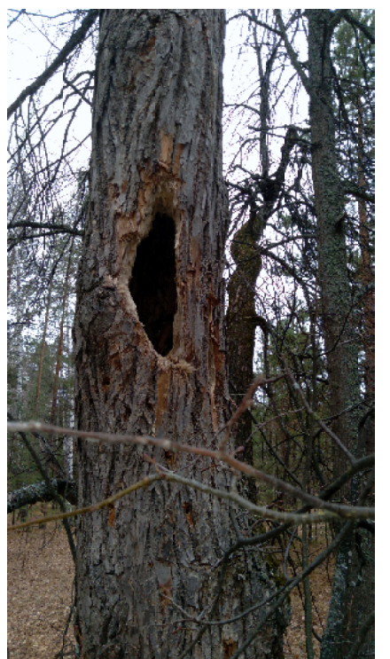
Борть отыскал несколько дней назад. Но, уже без пчёл...

Некоторые аграрии утверждают, что орехи – хлеб будущего. И призывают граждан России к культурному разведению лесного ореха – лещины.