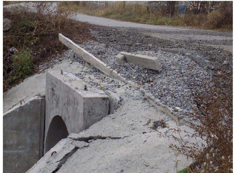
Бетонные монолитные плиты потрескались – и года не прошло

землю, зимой бетон залили, весной он и просел».