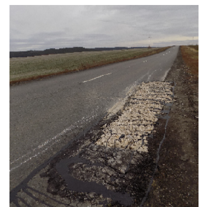
Отремонтированная в 2020-м году дорога «Кузнецк – Марьевка»

зённого учреждения «Управление строительства и дорожного хозяйства Пензенской области» был заасфальтирован участок проезжей части от города до села Марьевка, соседствующего с Бестянкой. Контракт был заключен с пензенской организацией на общую сумму свыше 35 миллионов рублей (далее ремонт продолжился до с. Индерка). И так, прошлой осенью дорога была отремонтирована, весной подрядчик восстанавливал не переживший зиму асфальт – по кромке проезжей части. Лето тоже оказалось губительным для дороги – ремонт отремонтированного продолжается.