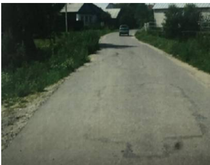
Дорога по ул. Центральной до и после ремонта. Разница заметна? (Фото слева из акта осмотра, приложенного к конкурсной документации)