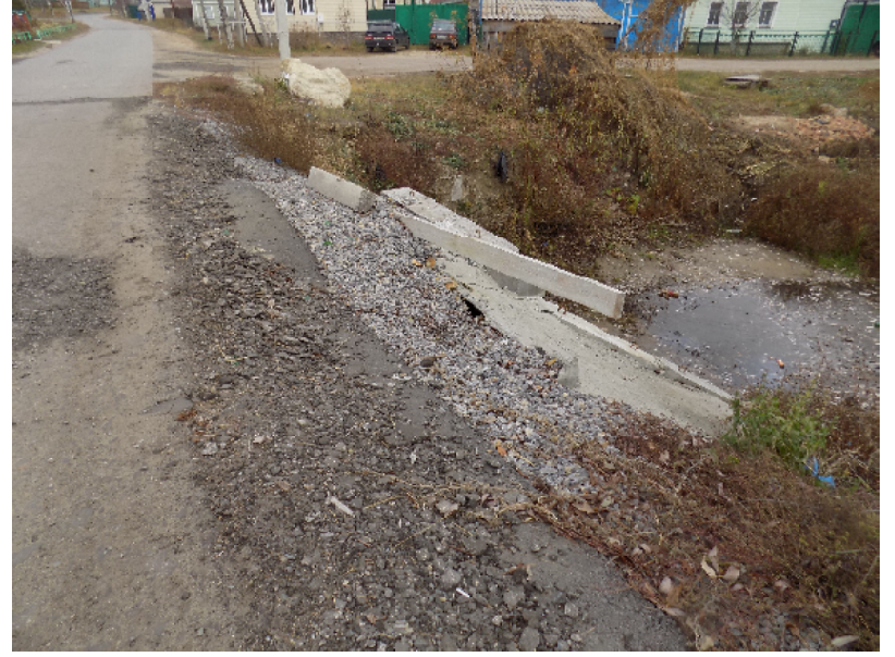
Обочины укреплены, пешеходные дорожки обустроены?

«Весной мост провалился – ямы по полметра были. Водитель школьного автобуса отказывался по этому участку детей везти – высаживал и дальше школьники пешком шли», – рассказывает один из местных жителей. И называет причину недолговечности работ: «Ремонт делали в зиму – в декабре закончили, укладывали глыбы в мёрзлую