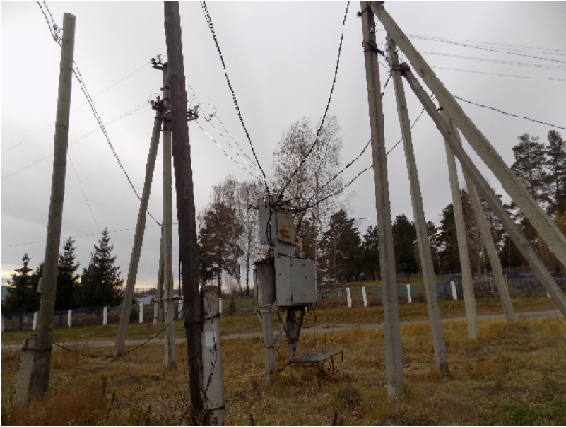
Слабенькая подстанция с частично заменёнными столбами