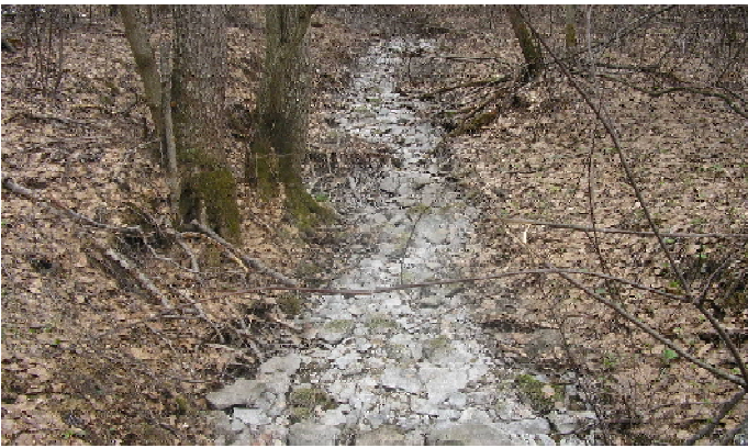
Известковый намыв показывает, что Липейка периодически выходит на поверхность