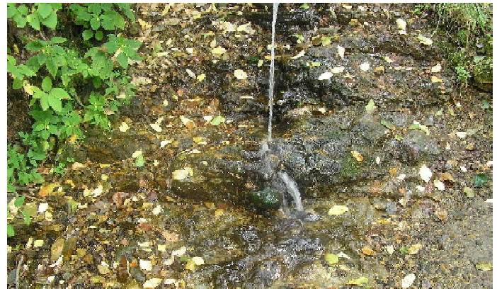
Одна из струек небольшого водопада, порождаемого Липейским ручьём

Землепроходством я увлечён с детства, верен благородному занятию по сию пору. Увлечённому, естественно, хочется увлечь других предметом своей страсти. Потому и подключаюсь (давно подключился) к поиску чего-то такого из мира дикой природы края, что заинтересует кузнецанина и позовёт его в дорогу.