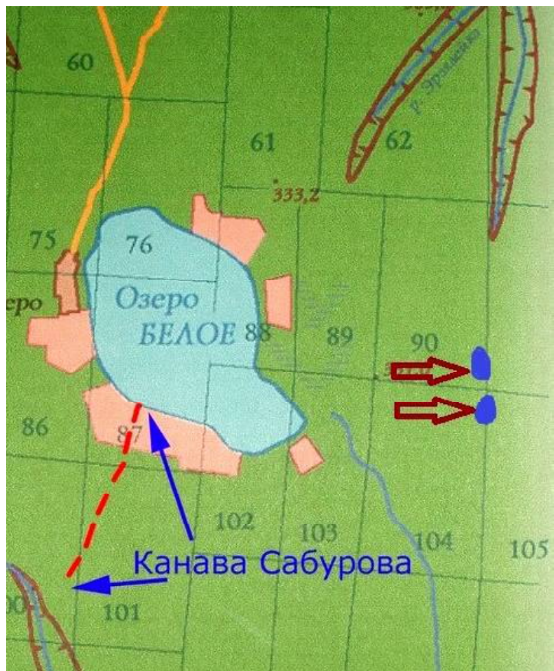
Карта конца 1970-х. Малое озеро, оно же Горелое, не нанесено. «Нарисовали» сами. На окнища-озерки указывают «толстые» стрелки.