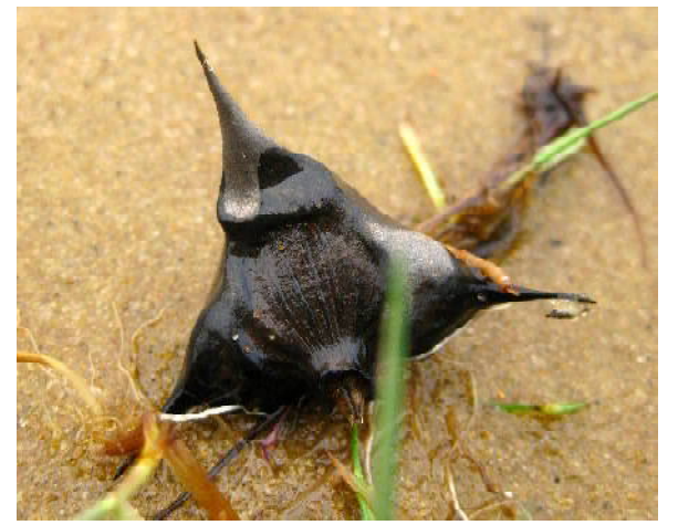
«розетка» и плод рогольника плавающего

пределах Сурской луки Форум пензенских краеведов называется затон старого русла Суры, близ фабрики «Маяк», а в пределах Лунинского района – озеро Чапчор. Пользователь Сергей Назаров пишет, что находил «такую штуку» на старице Суры близ села Пыркино Бессоновского района... Всё, что осталось от плантаций промышленного масштаба.