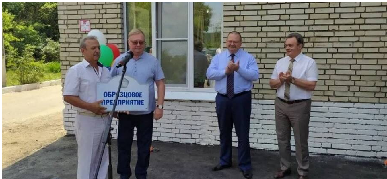
14 июля 2021-го года