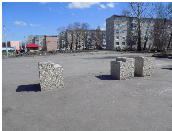
Здесь была скамейка

го они класса признали, но мы класс называть не будем, мало ли... может быть, обозначились свидетели. С другой стороны, понятно, что не будет взрослый человек сердечки рисовать, а совершеннолетняя девушка так бездарно свою косметику тратить. Надписи с претензией на граффити, очевидно, дело молодых рук. Проверить догадки или даже доказать, чьи именно руки это нехорошее дело, возможно.