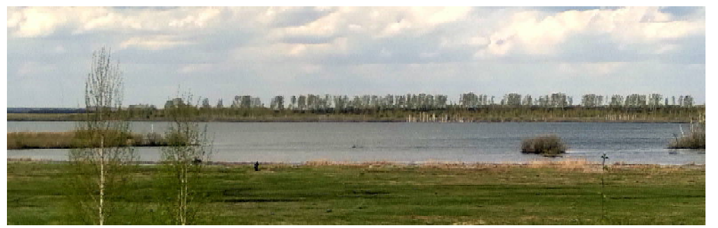
Год назад остров размещался в центре снимка, загрохивая обзор северного берега. Теперь, как видим, чистая акватория