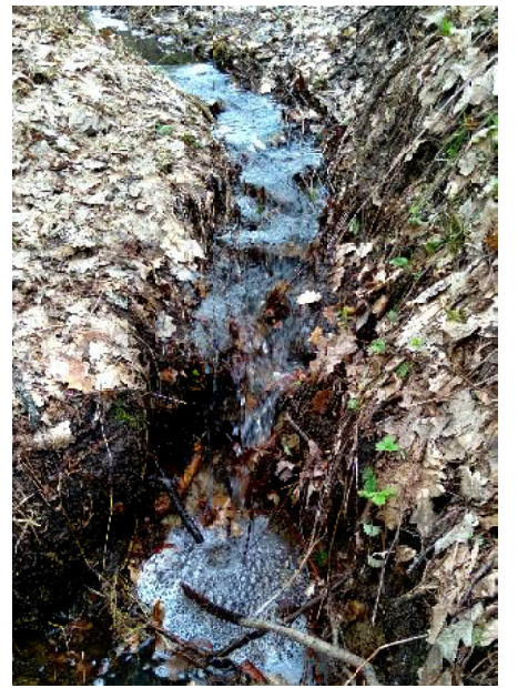
А это формирующийся водопад в овраге возле Бобровского озера

На одном из «бобровских» оврагов обнаружил почти то же явление, что и на «медаевских»: водопад. Вернее, водопадик. В сравнении с «медаевским» он совсем крохотный, но по нему можно наглядно проследить процесс формирования подобных явлений природы нашей местности. А