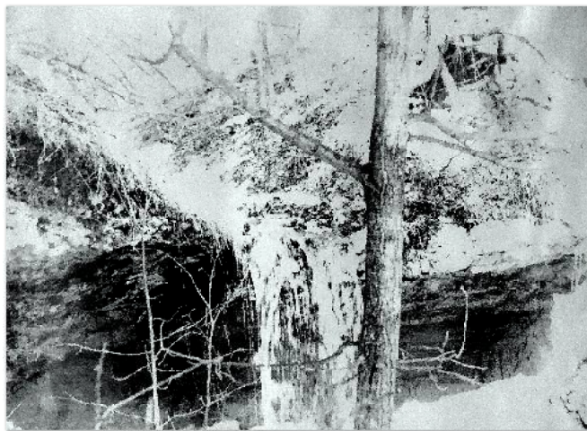
Скан моей старой фотографии сезонного водопада в Первом овраге

***Великие «авантюристы» путешествий и открытий Тур Хейердал и Руаль Амундсен подобно Арсеньеву обладали завидным литературным даром.