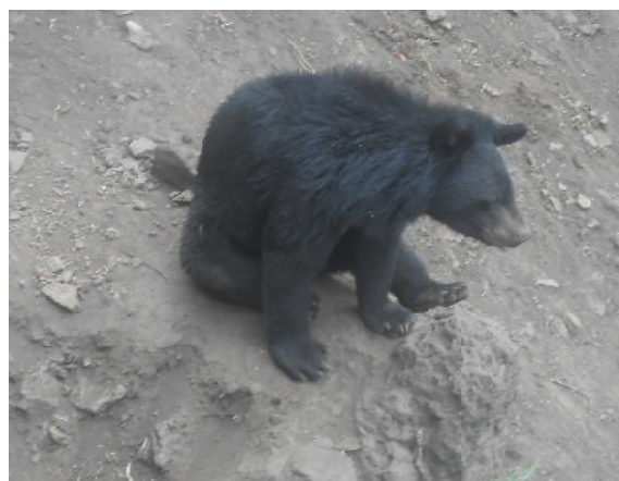
Неожиданная встреча с медведем

Надо заметить, что экскурсионные туры на Камчатку дорогостоящие: от 100 до 180 тысяч рублей, а отдельная экскурсия в Долину гейзеров обойдется вам минимум в 30 тысяч рублей. Если в программе вашего тура обозначена рыбалка, то надо быть готовым к тому, что рыбачить вы будете с помощью удочки неподалеку от берега в Моховой бухте. В качестве улова вам придется довольствоваться десятком морских линий. Эта рыба костлявая (типа нашего леща) и, можно сказать, несъедобная.