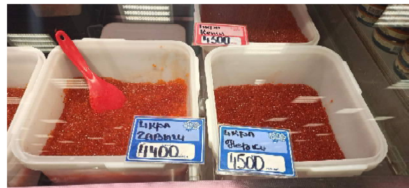
Умопомрачительные цены на икру

На этой минорной ноте приходится закончить повествование о самом прекрасном заповедном уголке России.