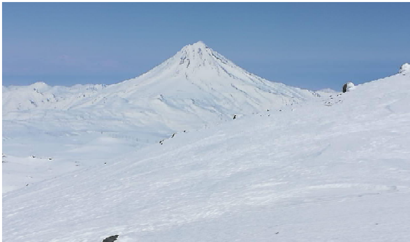
Камчатский вулкан Горелый

Камчатка — самый отдаленный уголок нашей страны. Географические особенности и первозданная природа привлекают сюда туристов. На территории Камчатки есть действующие вулканы, много