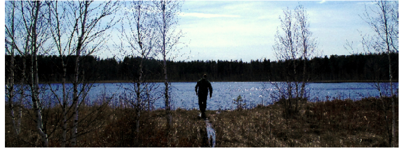
А это озеро Светлое, некоторыми тоже рассматриваемое как один из кандидатов на звание «Второго Малого Белого»

Что оказалось на деле: «Скит» — это землянки-кельи