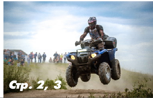
Стр. 2, 3