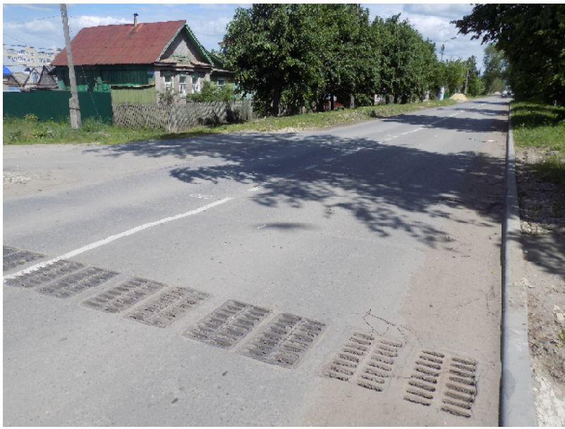
(Окончание. Начало на стр. 1)

формальный) в установленном законом месячный срок не дали. Получила председатель совета МКД ответ только 9-го июня... и не очень поняла: а понял ли глава администрации, о чём его просят.