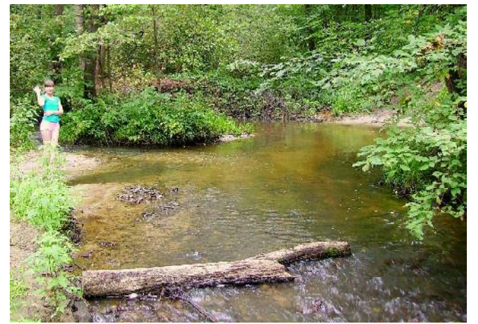
Именно здесь автобусы и прочая техника преодолевали вброд реку Медаевку.

Я не раз наблюдал со стороны и форсированные «пазиком» Медаев-