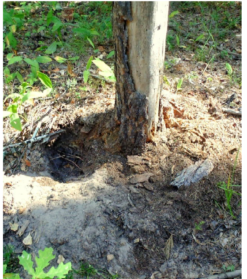
Разбросанный муравейник и «порои» (подкопы). Медведь? Кабан? Барсук?

Делаем привал на «базе у Пятиямной». Это срубная избушка-четырёхстенок возле одноимённой маленькой речки, притока реки Час. Отдыхаем после двухчасовых хождений в поисках северной орхидеи неоттианты (гнездоцветки) клубочковой. Сидим по-дачному: на скамейках за столом у избушки под сенью навеса и вековых сосен (хвала тем, кто «устро-