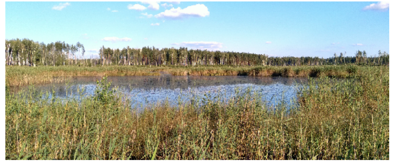
Это не всё озеро, а первый «взятый» нами его плёс

А мне на волне этих «сказаний» вспомнилась легенда о Семлёвском озере и Наполеоне. Завоеватель половины мира, так и не покоривший Россию, отступая, якобы приказал утопить часть награбленных московских сокровищ в том водоёме. Несколько научных эк-