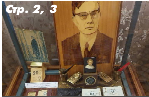
Стр. 2, 3