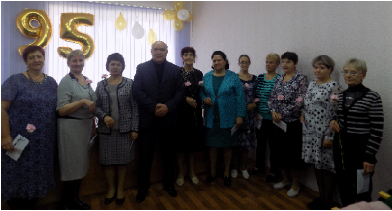
«Кузнецкий хлебокомбинат» отпраздновал свое 95-летие.