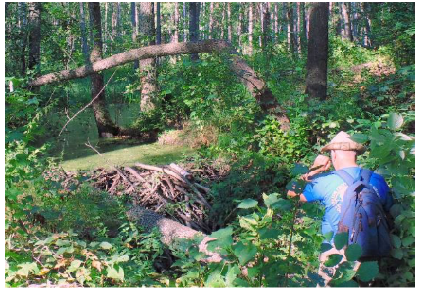
Кармала в бобровых плотинах

До ближайшего населённого пункта – села Часы – отсюда шесть километров бездорожьем. Но на другом берегу Кармалы, метрах в двухстах от «заимки», когда-то располагался кордон. Кордон на языке работников леса значит – дом лесника. Впрочем, он, как единица лесного хозяйства и социально-жилой структуры, мог состоять не из одного, а из нескольких домов. К жилым и надворным постройкам могла примыкать лаборатория, учебный класс, метеоро-